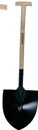
Pala punta mango muleta