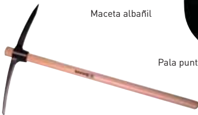
Alcotana 3 albañil