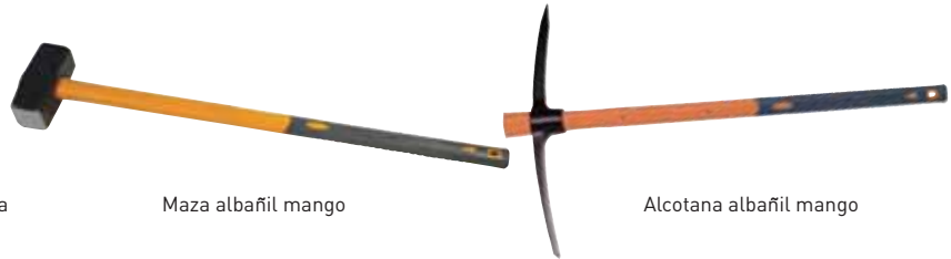
Maza albañil mango